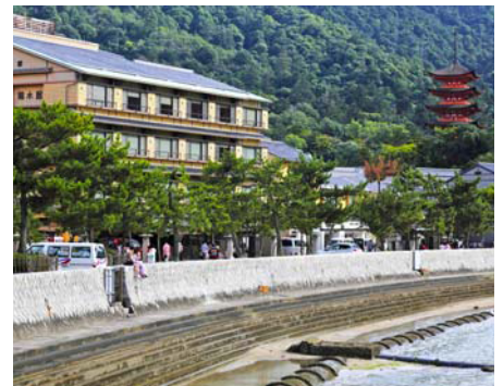
目の前に瀬戸内海と宮島のシンボル大鳥居を望む絶景のロケーション。宮島で唯一の天然潮湯温泉と地元の海の幸、山の幸が自慢の老舗の温泉旅館。厳島神社まで徒歩3分と好立地。